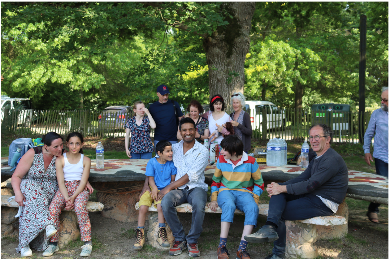
Photos de Rencontres Régionales financées par nos mécènes